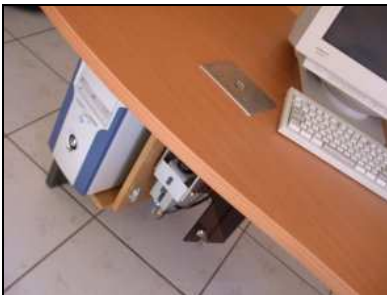
Vue du matériel

Iris offre ainsi la possibilité de réagir au besoin sur les paramètres de fabrication si l'on constate des dérivés par rapport au standard qualité.